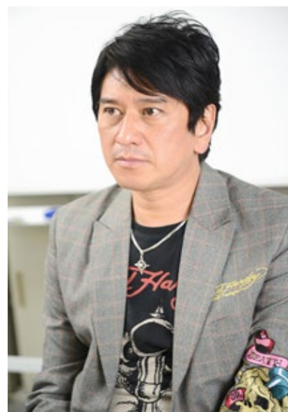
インタビュアー 川崎麻世 (タレント)